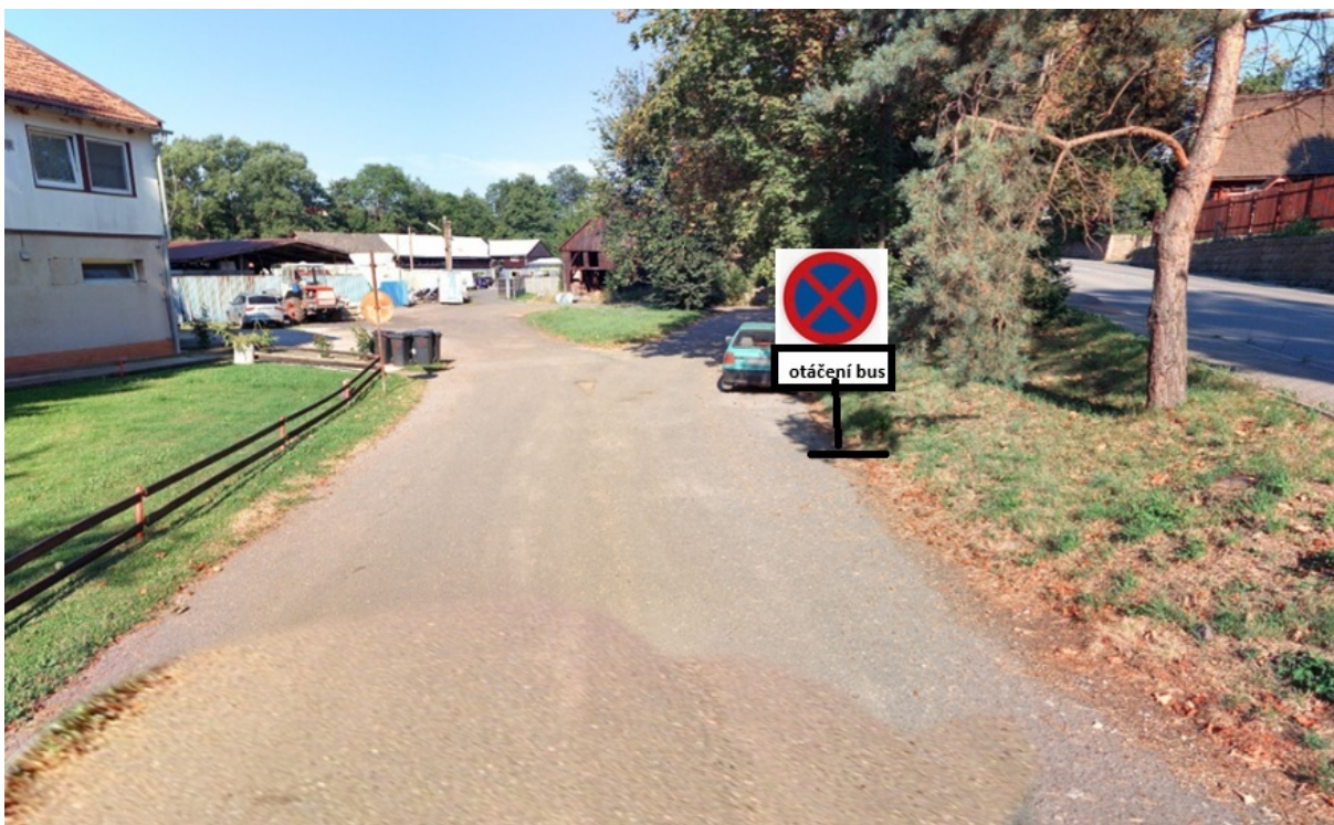
Obrázek 2 zákaz zastavení, otáčení Verdek

Pro zajištění obsluhy místní části Vorlech bude vedena ulicí Nerudova a Vrchlického (jsou v licenci) vybrané spoje linky 692414. zastávka Nerudova bude mít dočasně druhé stanoviště pro směr z centra města.