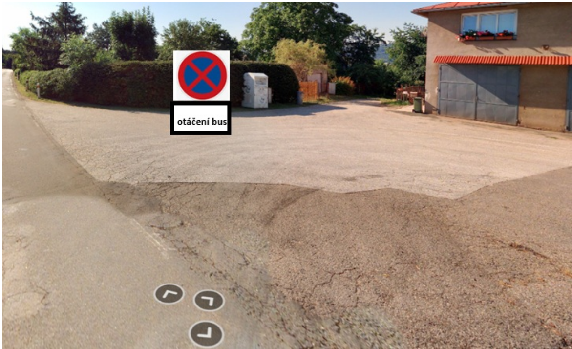
Obrázek 4 místo otáčení autobusů Nemojov

Z důvodu zajištění otáčení vozidel na původně okružní lince 414 požadujeme doplnění dopravního značení v Nemojově u bývalé hasičské zbrojnice, aby zde byl prostor celý den pro otáčení autobusů, viz Obrázek 4.