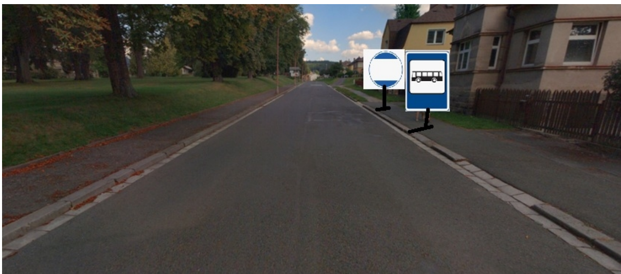
Obrázek 3 návrh umístění nového stanoviště zast. Dvůr Králové n. L., Nerudova

Pro zajištění obsluhy místní části Vorlech bude vedena ulicí Nerudova a Vrchlického (jsou v licenci) vybrané spoje linky 692414. zastávka Nerudova bude mít dočasně druhé stanoviště pro směr z centra města.