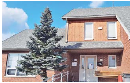
Chráněné bydlení – Stříbrný dům.

Na území města Dvůr Králové nad Labem se nacházejí dva rodinné domky, v nichž je poskytována pobytová sociální služba Chráněné bydlení. Klientům poskytují podporu pracovníci v sociálních službách, a to v rozsahu jejich individuálních potřeb. Klienti jsou vedeni k vlastní zodpovědnosti a samostatnosti. Prostřednictvím nácviků si upevňují dovednosti týkající se běžných činností jako péče o vlastní osobu, péče o domácnost, hospodaření s peněží, činnosti související s volnočasovými zájmy aj. V místě svého bydliště rovněž klienti využívají běžně dostupné služby – restaurace, kadeřník, pedikúra, obchody apod.