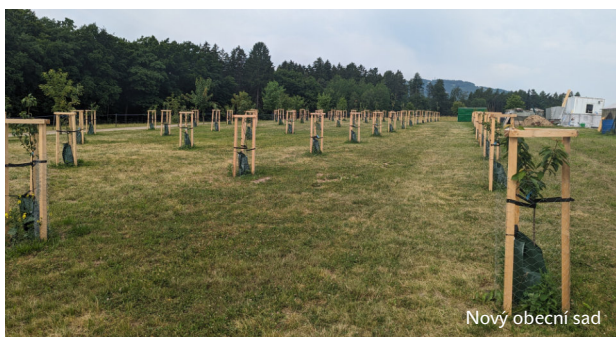
Nový obecní sad

Fotografii demolice kulturního domu provedl královédvorský občan I.Š.1980.Demolici střechy provedli:Kudrnovský P.,Štych S. Šulo L. Zoufalý B. Zoufalý J.Š.Demolice se započalo 26.7.1980, a skončeno 9.8.1980.Větší část stavby a cihel odstranil Ervert R. s manželkou,Malý Z.Řežant J.a M.Kuhn.Na odstranění střechy bylo odpracováno 288hodin.